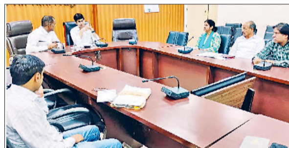
रेवाड़ी। नीट परीक्षा के संबंध में अधिकारियों के साथ बैठक करते हुए डीसी अभिषेक मीणा।

जिला में होने वाली नीट परीक्षा की तैयारियों को लेकर शुक्रवार को डीसी अभिषेक मीणा की अध्यक्षता में लघु सचिवालय के सभागार में बैठक आयोजित की गई। इस मौके पर डीसी ने अधिकारियों को परीक्षा के सफल एवं सुचारू संचालन के लिए आवश्यक दिशा-निर्देश दिए। इससे पहले नीट परीक्षा के आयोजन को लेकर हरियाणा के मुख्य सचिव अनुराग रस्तोगी ने जिलों के डीसी व अन्य अधिकारियों को वीसी के माध्यम से सभी व्यवस्थाएं समय रहते सुनिश्चित करने के निर्देश दिए। डीसी मीणा ने कहा कि जिले में 3 मई को आयोजित होने वाली नीट परीक्षा के लिए सभी परीक्षा केंद्रों पर मूलभूत सुविधाएं जैसे स्वच्छ पेयजल, शौचालय, बिजली तथा बैठने की उचित व्यवस्था की जाए।