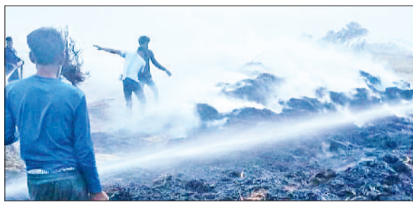
रेवाड़ी। गेहूं की फसल में लगी आग बुझाते दमकल कर्मी।

यदि क्षेत्र में कोई भी व्यक्ति अवैध नशा बेचता है, तो उसकी सूचना रूप से नशे का कारोबार करता है या तुरंत पुलिस को दें।