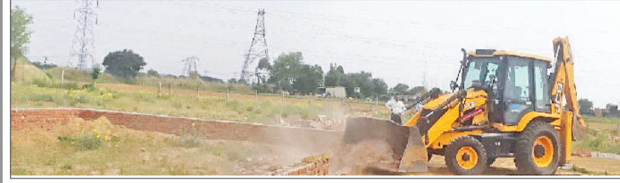
रेवाड़ी। अलावलपुर में अवैध कॉलोनी का निर्माण तोड़ती जेसीबी तथा अवैध निर्माण तोड़ती जेसीबी