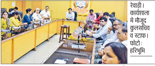
रेवाड़ी। कार्यशाला में मौजूद कुलसचिव व स्टाफ।

इंदिरा गांधी विश्वविद्यालय ने बौद्धिक संपदा अधिकार प्रकोष्ठ, कंप्यूटर विज्ञान एवं अभियांत्रिकी विभाग और भौतिकी विभाग के माध्यम तथा भारत सरकार के वाणिज्य एवं आंतरिक व्यापार संवर्धन विभाग के सहयोग से राष्ट्रीय बौद्धिक संपदा जागरूकता मिशन के तत्वावधान में ऑनलाइन कार्यशाला का आयोजन किया गया। कार्यशाला का विषय 'बौद्धिक संपदा अधिकार की मूल बातें: ज्ञान अर्थव्यवस्था की नींव' रहा। कार्यशाला में 250 से अधिक छात्रों, शोधकर्ताओं और संकाय