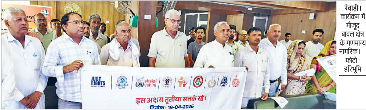
हरिभूमि न्यूज़ ▶▶ बावल