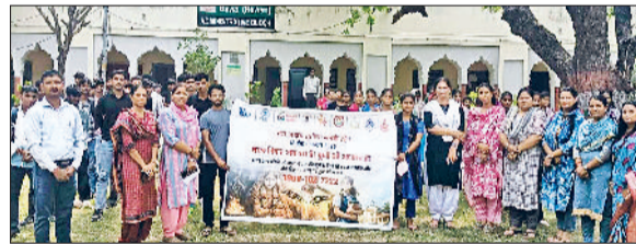
रेवाड़ी। कार्यक्रम में मौजूद शिक्षक व विद्यार्थी।