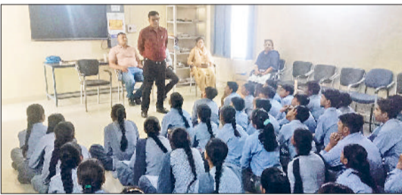
रेवाड़ी। विद्यार्थियों को नशे के दुष्प्रभाव बताते हुए पुलिस टीम।

जिला पुलिस ने युवाओं व आमजन को नशे से दूर रहने और खेलों से जोड़ने के लिए विशेष अभियान चलाया हुआ है। पुलिस की नशा मुक्त टीम योजना डोर टू डोर सम्पर्क करके लोगों को नशे के विरुद्ध जागरूक कर रही है। अभियान के तहत पुलिस की नशा मुक्त टीम ने शुक्रवार को गवर्नमेंट स्कूल गांव खरखड़ा में विद्यार्थियों व आमजन को नशे से दूर रहने तथा शिक्षा व खेलों से जुड़ने के लिए प्रेरित किया। उन्होंने सभी को नशा न करने की शपथ भी दिलाई। शुक्रवार को पुलिस टीम ने एक नशा पीड़ित व्यक्ति की पहचान भी की।