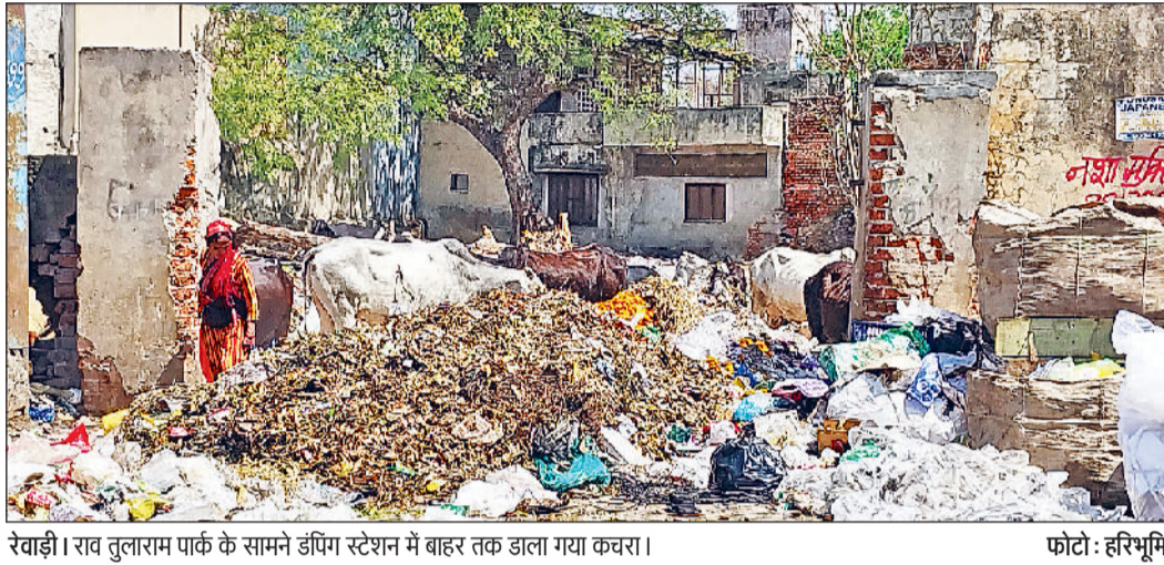
रेवाड़ी। राव तुलाराम पार्क के सामने डंपिंग स्टेशन में बाहर तक डाला गया कचरा।

शहर की सफाई व्यवस्था सुधरने का नाम नहीं ले रही है। शहर की मुख्य सड़कों पर डाले जा रहे कचरे का समय पर उठान नहीं किया जा रहा है। मोहल्लों व कॉलोनियों में पूरी तरह डोर-टू-डोर कचरा कलेक्शन की गाड़ियां तक नहीं पहुंच रही हैं। डंपरों व ट्रैक्टरों में बिना ढके कचरे को बाजार से लोगों के बीच से ले जाया जा रहा है, जबकि कचरा वाहन को ग्रीन कपड़े से कवर करना जरूरी है। शुक्रवार को कचरे से भरा एक डंपर व ट्रैक्टर पूरे दिन महाराणा प्रताप चौक स्थित सफाई शाखा कार्यालय की बाउंड्री में बिना ढके खड़ा रहा, जिससे पूरे दिन दुर्गंध फैलने से लोगों को परेशानी उठानी पड़ी। सड़कों पर डाले गए कचरे का दो-तीन दिन तक उठान तक नहीं हो रहा है, जिससे कचरा वापस सड़क पर फैल रहा है। सफाई व्यवस्था सुधरने के बजाय बिगड़ती जा रही है। नगर परिषद की लापरवाही के कारण गत वर्ष के तरह इस बार भी स्वच्छता सर्वेक्षण रैंकिंग बिगड़ने के पूरे आसार नजर आ रहे हैं। गत वर्ष शहर रैंकिंग में पिछड़ गया था। इस बार भी शहर की सफाई व्यवस्था सहित शौचालयों के हालत भी दयनीय बने हुए हैं। शहर में डोर-टू-डोर कचरा प्रबंधन का पांच साल के लिए 23.5 करोड़ का टेंडर होने के बाद भी शहर की सफाई व्यवस्था बिगड़ी हुई है।