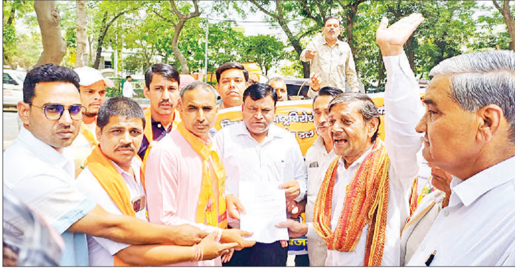
रेवाड़ी। डीडीपीओ को ज्ञापन सौंपते हुए विहिप व बजरंग दल के कार्यकर्ता।