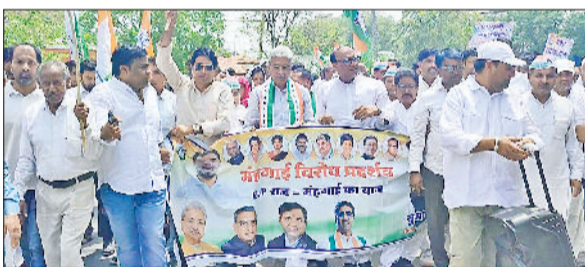
रेवाड़ी। डीसी को ज्ञापन देने जाते कांग्रेसी कार्यकर्ता तथा अनाजमंडी में फसल खरीद का जायजा लेते कांग्रेसी।