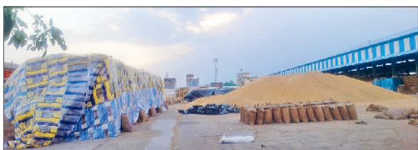
रेवाड़ी। कोसली अनाज मंडी में खुले में पड़ा गेहूं।

उन्होंने बताया कि बाल विवाह निषेध अधिनियम, 2006 के अनुसार कानून अपराध है। उन्होंने बाल विवाह के आयोजन के संबंध में जिला प्रशासन, सरपंच, पार्थिव व पुलिस को सूचना अवश्य दें, ताकि समय रहते बाल विवाह होने से रोका जा सके। इस अवसर पर विद्यार्थी व स्टाफ सदस्य मौजूद थे।